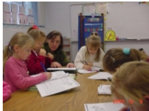
Урок письма у 1-"А" класі.

лише виграти. Хіба це не цікаво? Більшість дітей, що приходять у перший клас, зовсім незнайомі з українськими літерами, а тому нам доводиться починати з самого