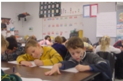
Учні 1-"Б" класу "за роботою".

Крім цього ми майже щосуботи пишемо диктанти. Учні вправляються не лише вірно читати склади і слова, але й записувати їх на слух.